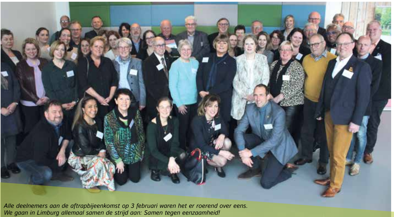
Alle deelnemers aan de aftrapbijeenkomst op 3 februari waren het er roerend over eens. We gaan in Limburg allemaal samen de strijd aan: Samen tegen eenzaamheid!

Samen tegen eenzaamheid zet in op het zoveel mogelijk voorkomen van eenzaamheid bij senioren door tijdige signalering en het benutten van de eigen kracht. Naast de Limburg brede beweging zijn er nog meer ambities. Bewustwording, bezinning en inspiratie rondom het thema eenzaamheid en het op gang brengen van initiatieven in wijken. Samen tegen eenzaamheid wil ook een partner zijn van de provincie bij het realiseren van het coalitieprogramma 2019-2023. Bovendien willen de projectpartners landelijk een voorbeeld zijn vanuit de eigen Limburgse kracht.